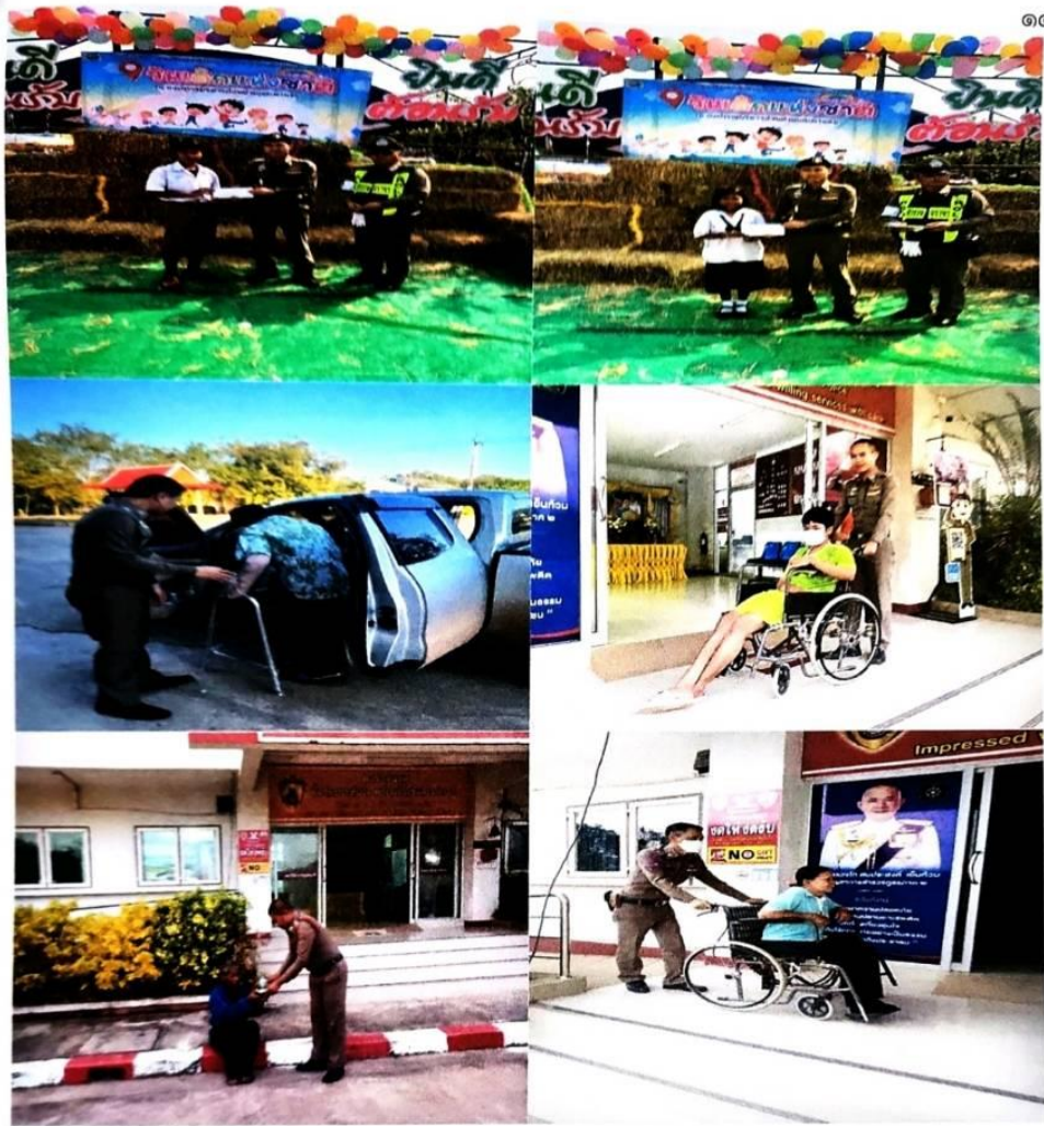
พนักงานสอบสวนในสังกัด สภ.นาดี ดำเนินการตามโครงการปิดทองหลังพระ แล้วรายงานผลการดำเนินการให้ ภ.จว. ปราจีนบุรี (กลุ่มงานสอบสวน) ทราบทุกวันศุกร์ของสัปดาห์